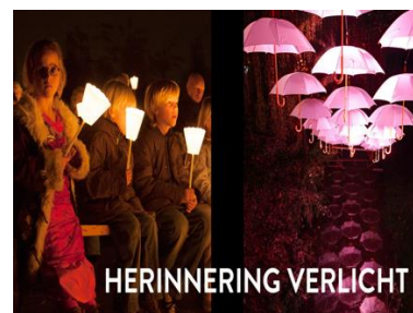
Lichtjesviering-museum Tot Zover