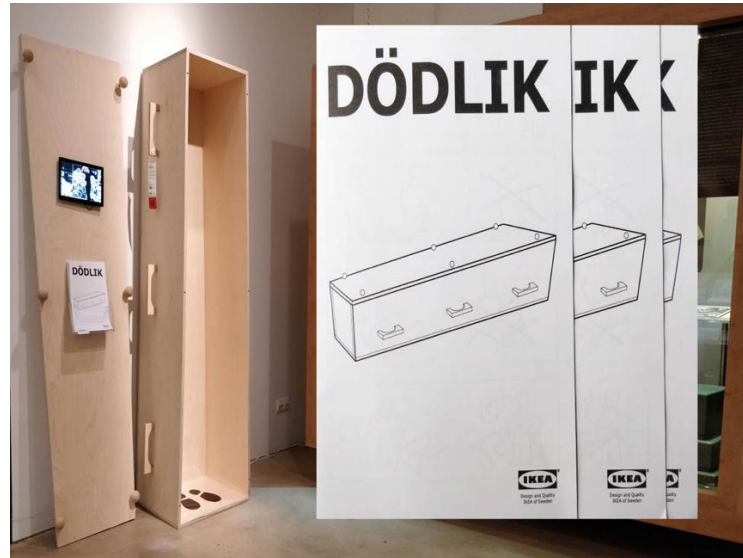
Kunstproject Dödlük - museum Tot Zover

‘Kunst kan mensen diep raken,’ stelt Cramwinckel. ‘We trekken niet de sentimentele kaart. Het gaat erom dat mensen de emotie herkennen en zich getroost voelen door de kunst.’