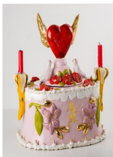
Persoonlijke urn – museum Tot Zover

De twintigste eeuw kende een kaalslag van rituelen, door de ontkerkelijking en de toename van crematies. In de jaren negentig groeide de aandacht voor de persoonlijke noot weer. Jonge artistieke mensen maakten afscheid nemen persoonlijk, bijvoorbeeld met een urn die bij de dode past. Er waren zelfs kunstenaars die uitvaartverzorger werden. Zo ontstonden nieuwe collectieve rituelen, zoals een lichtjesviering. ‘Je hebt kunstenaars nodig om dit te bedenken.’